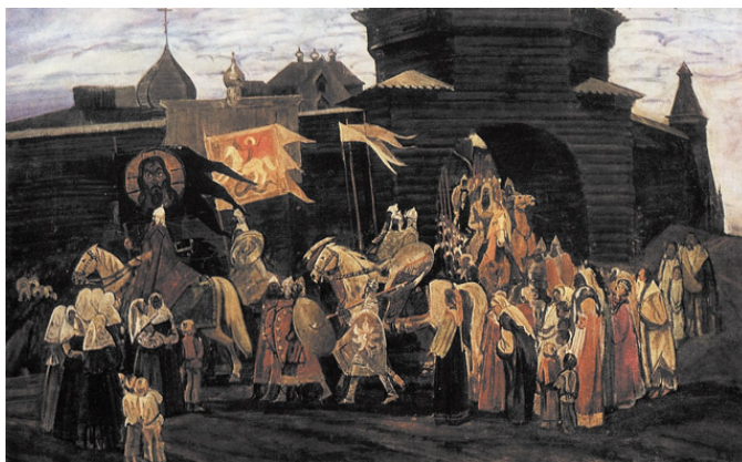
«На половецкие степи» Жабский А.