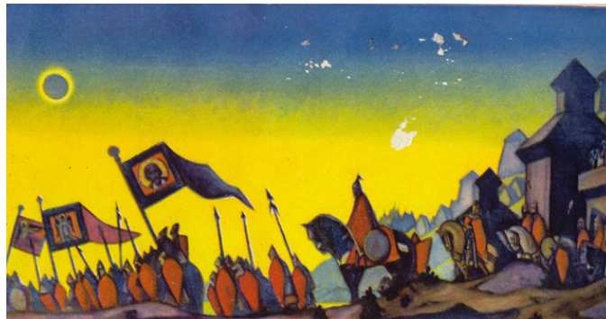
«Возвращение из похода князя Игоря Северского» Ходов В.