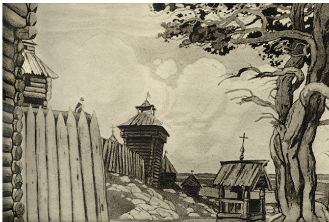
«Ярославна в Путивле на крепостной стене» Билибин И.