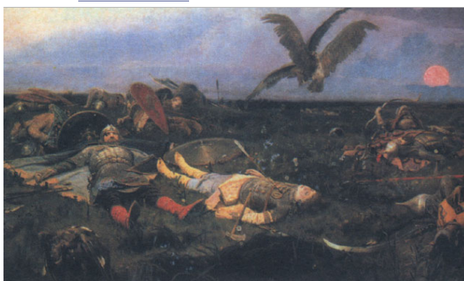
«После побоища Игоря Святославича с половцами» Васнецов В.М.