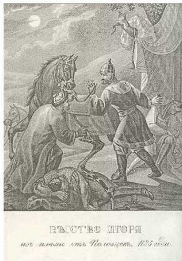
«Бегство князя Игоря из плена от половцев.» Чориков Б.